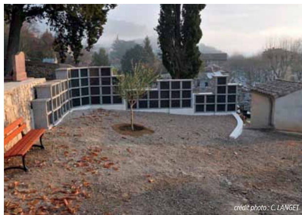
Le colombarium et son olivier

s'expriment, la création d'un jardin du souvenir pour répandre les cendres est en réflexion et fera partie d'un prochain aménagement. « La réglementation de ce genre d'équipement est très stricte, les eaux doivent être filtrées. Le cahier des charges ne souffre aucune imprécision dans le choix de l'emplacement qui doit être accessible aux personnes à mobilité réduite.»