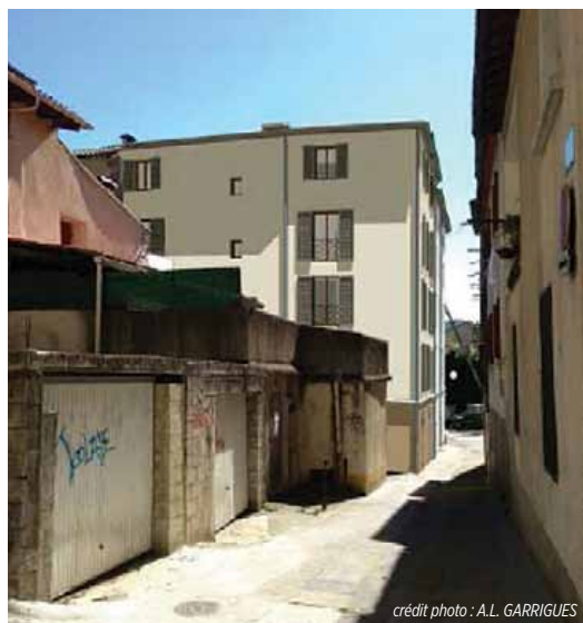
Cet immeuble ancien se trouve rue de la Forge

Cette opération permet la création d'appartements pouvant accueillir des familles en cœur de ville où l'offre locative actuelle se situe essentiellement sur des logements plus petits. De surcroît, elle s'inscrit dans la démarche de réhabilitation du centre ancien.