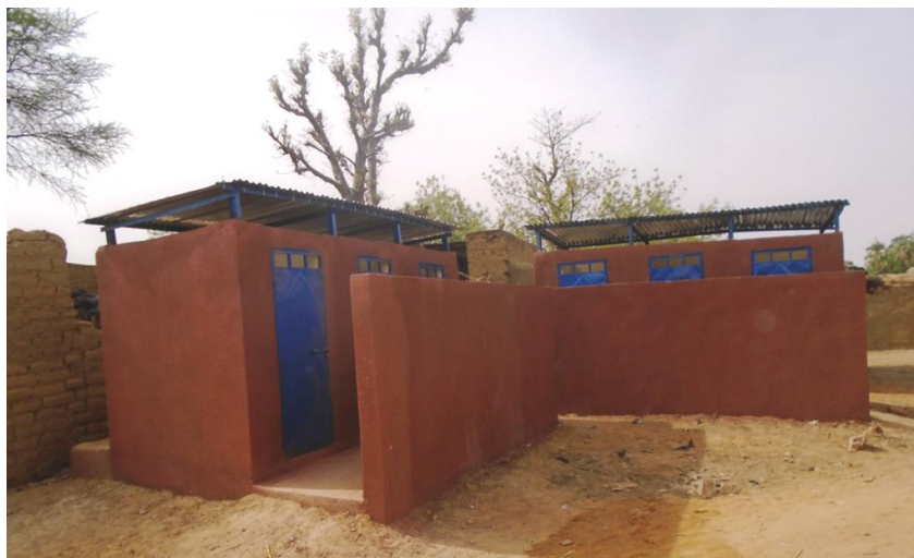
Un module de latrines publiques terminé