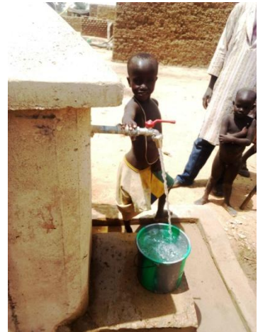
L'adduction d'eau de Témégolo et les premières gouttes d'eau aux bornes fontaines.

En octobre 2019 nous avons lancé la construction d'un nouveau puits moderne dans un quartier de Birga Dogon : jusqu'à maintenant les 350 familles devaient parcourir près de 2 kilomètres pour s'approvisionner en eau. Ce puits aura lui aussi une aire d'assainissement, un puisard et un dispositif d'abreuvement pour les animaux.