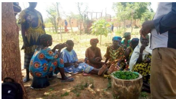
A gauche : fabrication du bio pesticide