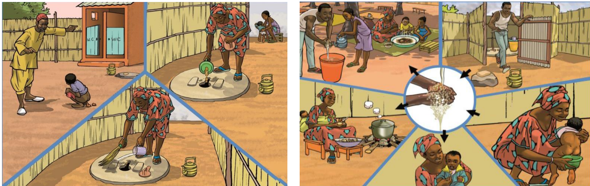
A gauche : la prévention des maladies grâce à la construction de latrines