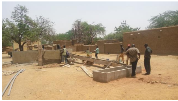
A gauche : le nouveau puits de Guindourou, avec son aire d'assainissement, son portique et sa clôture. A droite : la construction de l'abreuvoir à Birga Dogon.