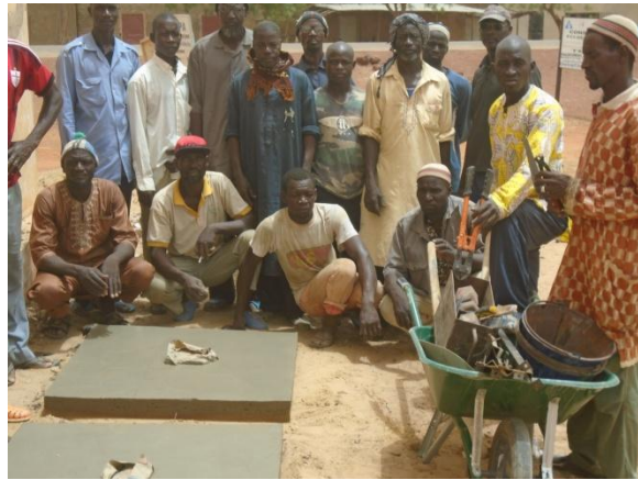
Formation à la construction des dalles Sanplat pour les latrines familiales.