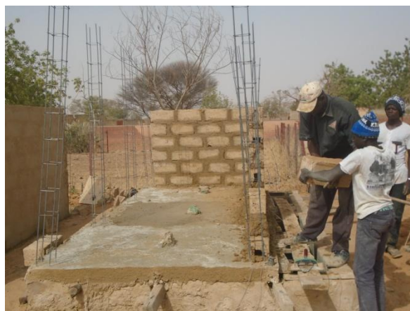
A droite : les dalles Sanplat au dessus de la fosse