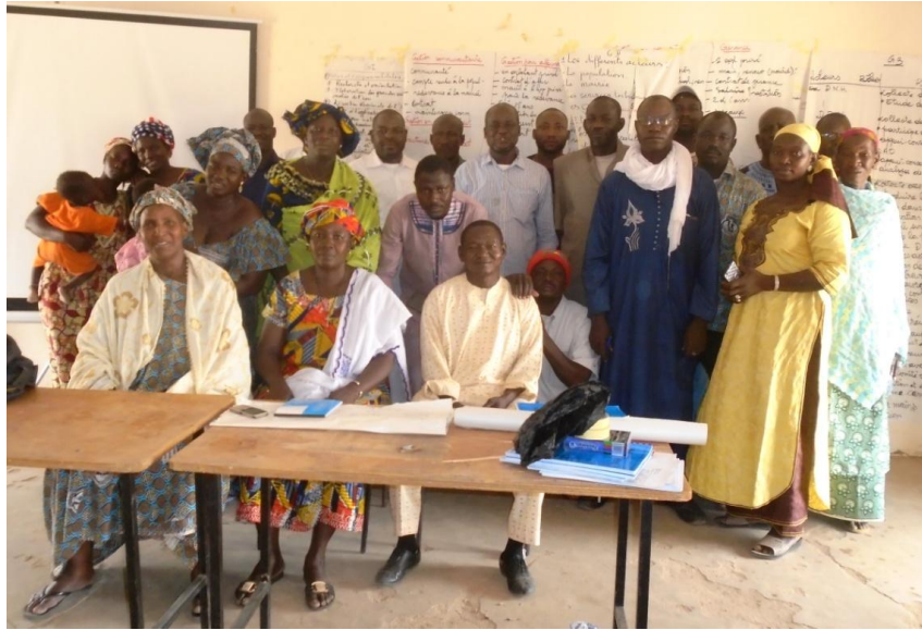
Le groupe des formés