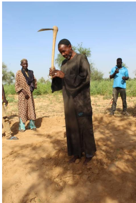
Les premiers coups de pioche par le Maire de Pel Maoudé et le chef du village de Birga Dogon