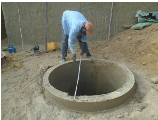
A gauche : la fosse étanche (les matières seront pompées, séchées et mises à composter)

Les travaux de construction des 28 latrines familiales équipées de puisards s'est achevée en octobre 2019. Il est à noter que pour bénéficier d'une latrine les familles ont dû participer financièrement à hauteur de 15€.