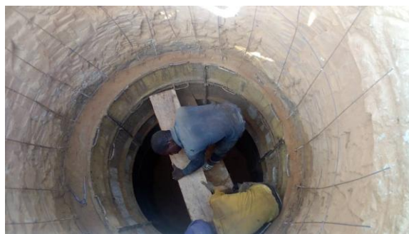
A gauche : les bénévoles du village autour du trou : ils vont remonter le sable et les roches dégagés à la pioche par les puisatiers, et pour la construction des buses ils vont chercher l'eau à 2 km du chantier. A droite : les maçons qui construisent les buses pour sécuriser le puits : un travail titanesque et dangereux !