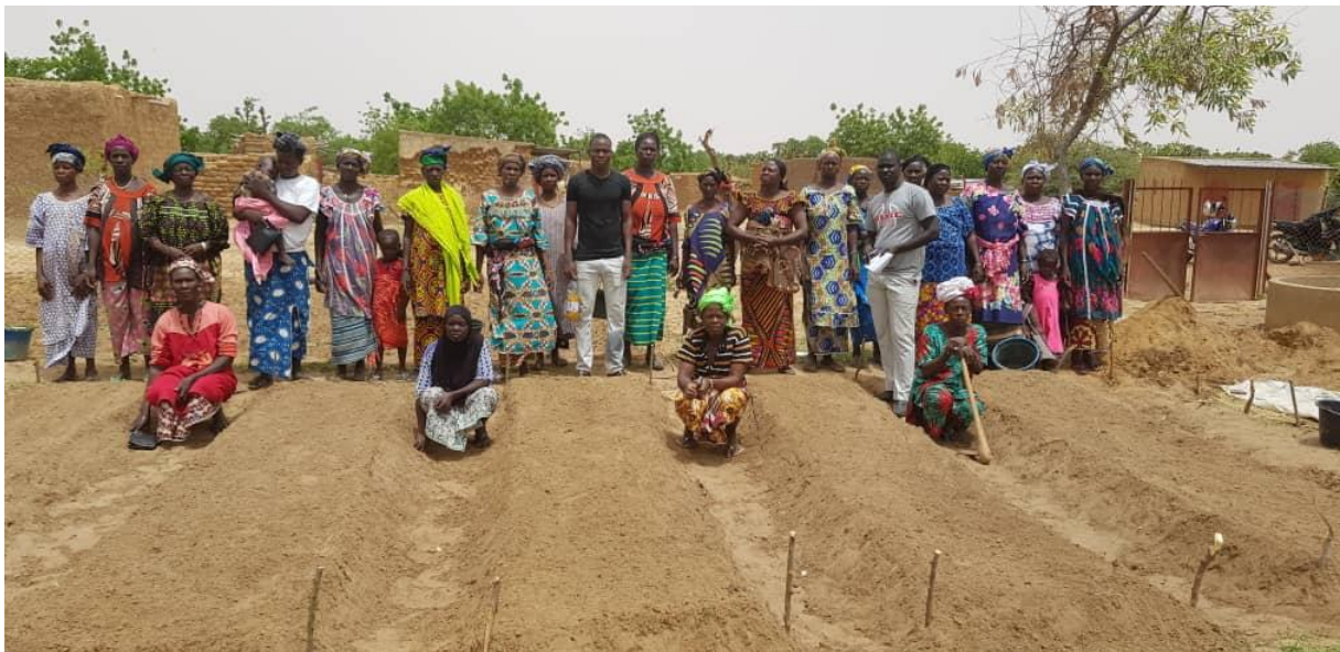
Les maraîchères fières de leurs planches de semis d'hivernage