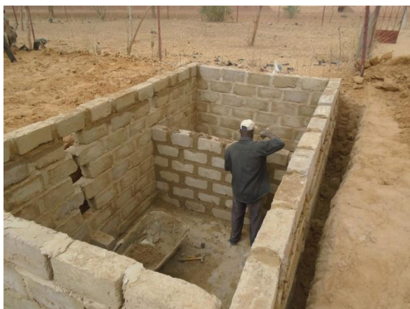
A gauche : la fosse

Un comité de gestion a été créé pour chacun d'entre eux.