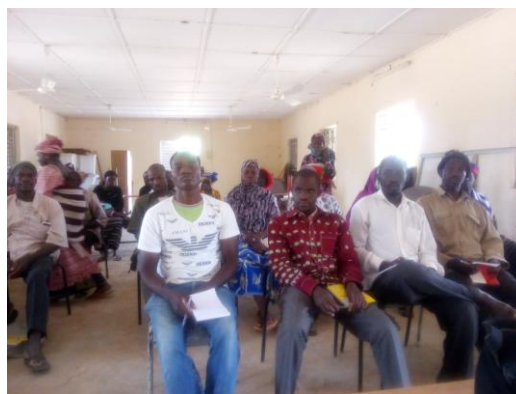
Photos des participants lors de la formation.