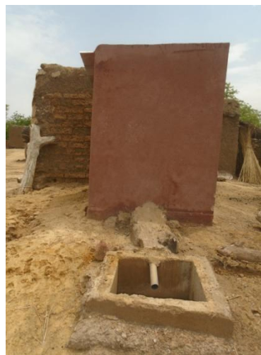
A droite : le puisard (il sera couvert, et les jus seront récupérés régulièrement pour les composts)