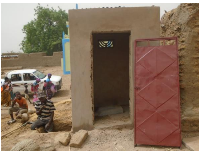
Deux latrines familiales quasiment terminées.