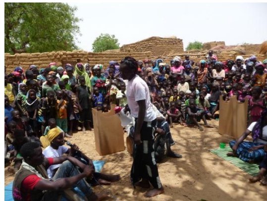
Les acteurs et l'effervescence de la population.